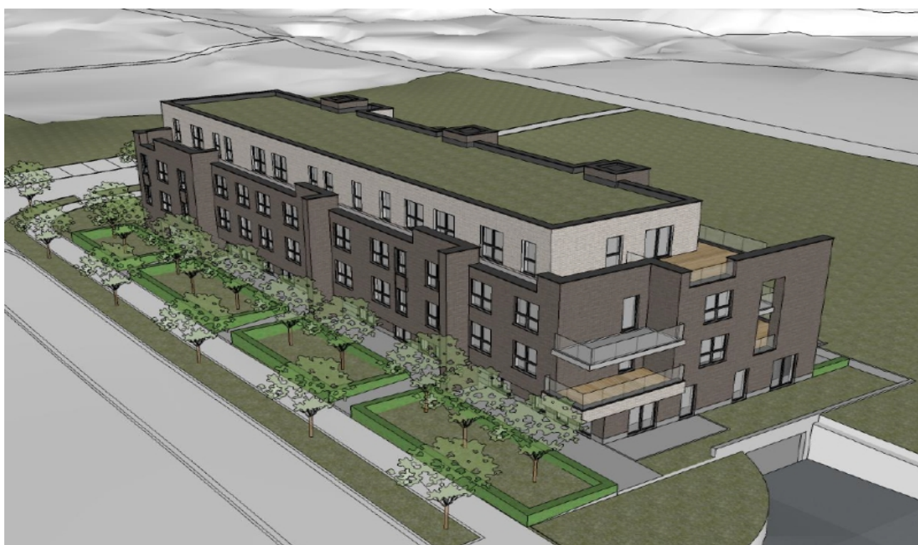
Perspective de l'immeuble P47

En partant de la gauche, perspective des immeubles P47, P48, P49 et P50. Le P51 est en voie d'occupation et le P48 en début de construction.